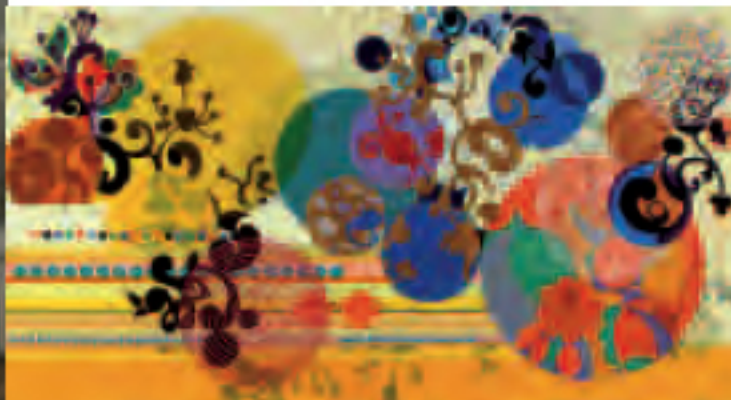
Beatriz Milhazes Modinha, 2007 Acrylique sur toile, 159 x 298 cm Collection privée

Galerie Favardin & De Verneuil 29, rue Duret 75116 Paris www.favardin-verneuil.fr Du 15 mars au 16 avril 2011